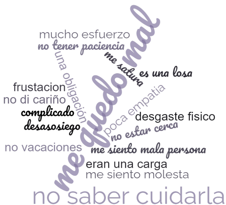
Figura 2. Palabras y frases cortas utilizadas por las mujeres para expresar su sentimiento de culpabilidad y frustración.

"...por un lado, la satisfacción de ayudarlo y, por otro lado, te sientes mal contigo misma porque yo digo que esto quiero que se acabe y volver con mi vida..."